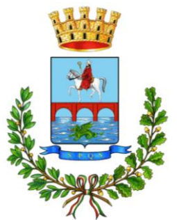
Città di Manfredonia